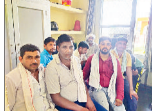
रोहतक। पावर हाउस भालोट में हुई बैठक में मौजूद कर्मचारी।