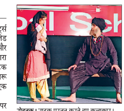
रोहतक। नाटक प्रस्तुत करते हुए कलाकार।