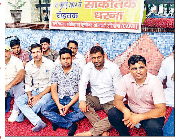
रोहतक। लघु सचिवालय परिसर के पास धरना देते हुए लिपिक।