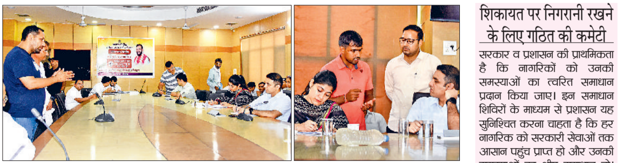
रोहतक। समाधान शिविर में लोगों की समस्याओं का समाधान करते हुए उपायुक्त अजय कुमार।

के निर्देश दिए तथा अधिकतर समस्याओं का मौके पर ही समाधान सुनिश्चित किया गया। उपायुक्त अजय कुमार ने कहा कि जिला व उपमंडल स्तर पर समाधान शिविर आयोजित करने का उद्देश्य लोगों की समस्याओं का त्वरित और प्रभावी समाधान करना है। उन्होंने कहा कि शिविर में नागरिक विभिन्न प्रकार की समस्याओं के बारे में शिकायतें लेकर आ रहे हैं, जिनमें समाधान प्रदान किए जा रहे हैं। भूमि विवाद, बिजली कनेक्शन, पंशन, और अन्य सरकारी योजनाओं से संबंधित मुद्दे शामिल हैं। मौके पर ही सभी विभागों के आला अधिकारी मौजूद रहते हैं और शिकायतों का त्वरित समाधान करने के लिए तत्काल कार्रवाई की जाती है। ज्यादातर मामलों में मौके पर ही समाधान प्रदान किए जा रहे हैं जबकि कुछ मामलों में, अधिकारियों ने शिकायतों का निपटारा करने के लिए एक निश्चित समय सीमा निर्धारित की है जिसमें समस्या का समाधान करने के सख्त निर्देश दिए गए हैं।